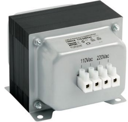
TIPO B / TYPE B