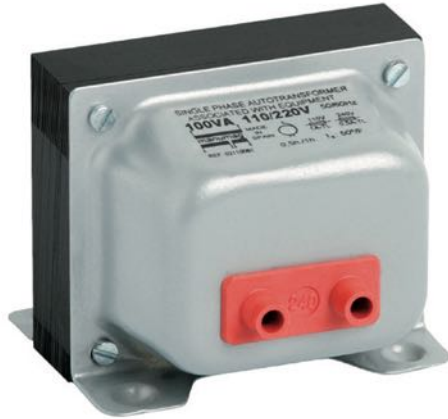
TIPO A / TYPE A